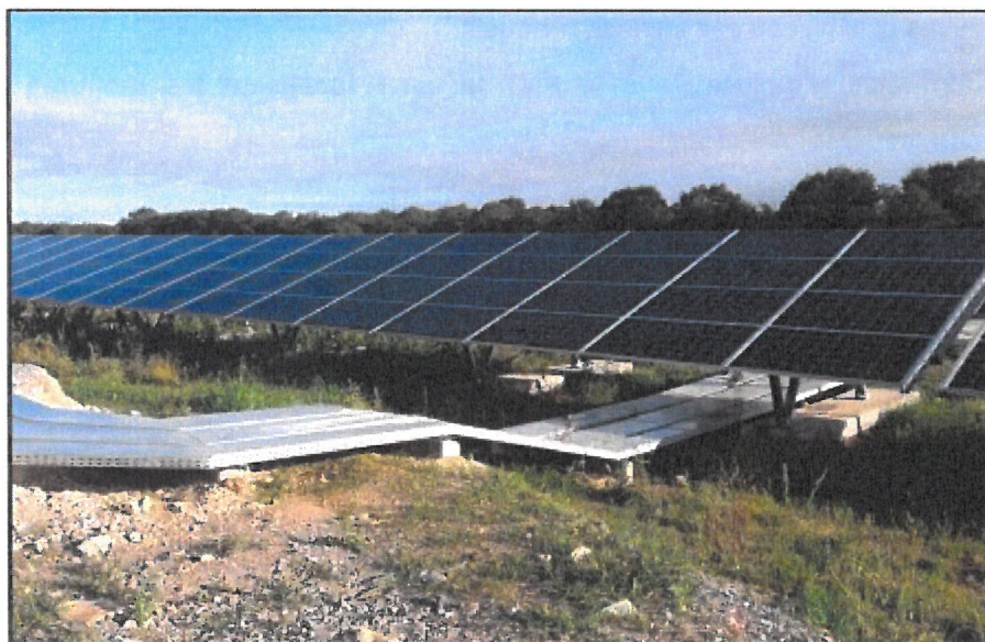
Exemple d'installation photovoltaïque en panneaux fixes (extrait du RNT)

L'exploitation photovoltaïque est prévue pour une durée de production de 35 ans. Au-delà, elle pourra être arrêtée ou poursuivie selon certaines conditions.